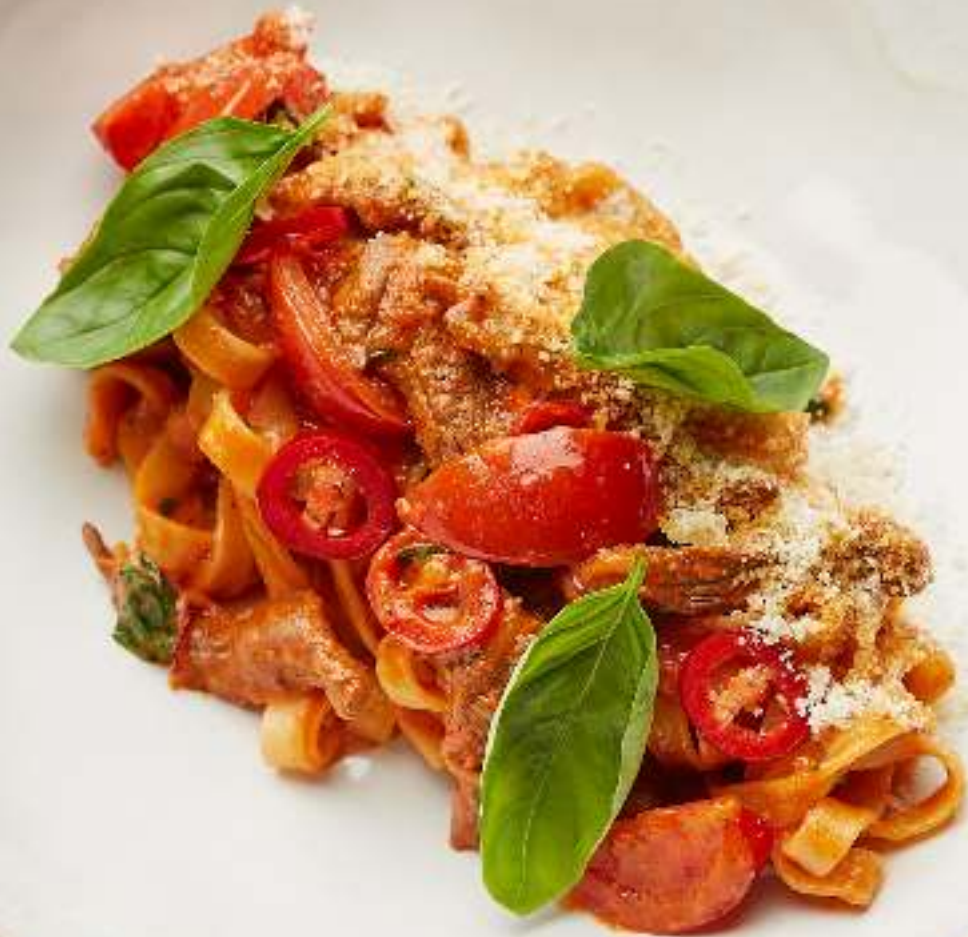
РИС И ПАСТА/PASTA AND RISE